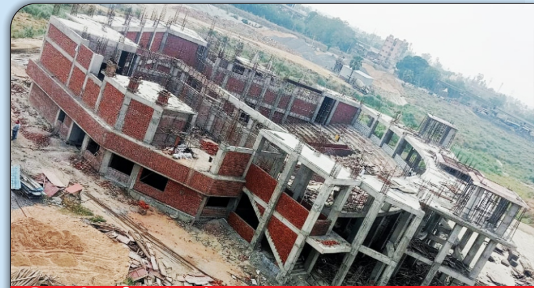
03 निर्माणाधीन प्रेक्षागृह