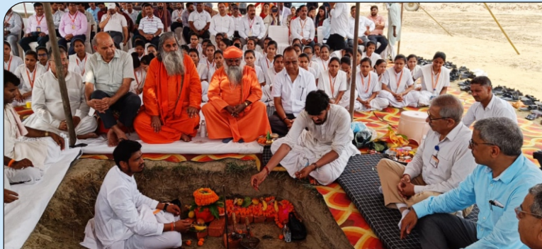
09 मेडिकल कॉलेज हेतु भूमि पूजन