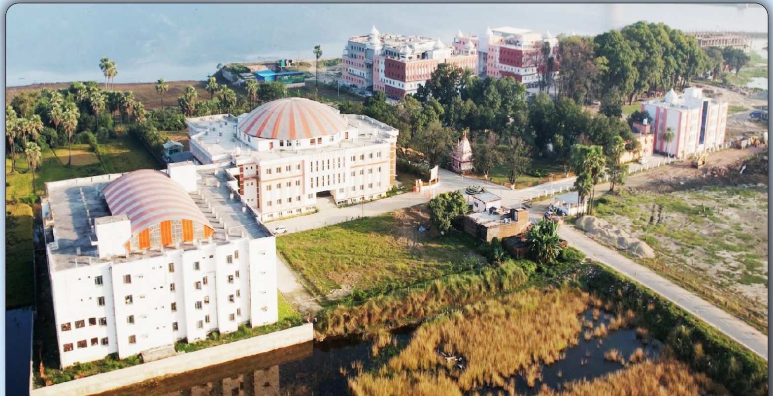
05 विश्वविद्यालय परिसर का वायवीय दृश्य