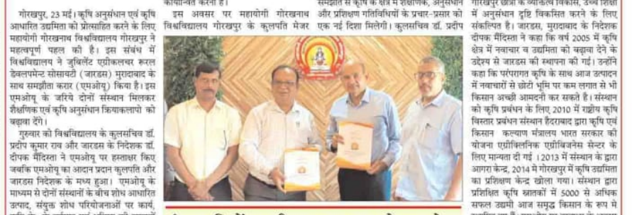
कृषि अनुसंधान एवं कृषि आधारित उद्यमिता को प्रोत्साहित करने के लिए महायोगी गोरखनाथ विश्वविद्यालय गोरखपुर ने महत्वपूर्ण पहल की है। इस संबंध में विश्वविद्यालय ने जुबिलेंट एग्रीकल्चर रूरल डेवलपमेंट सोसाइटी (जार्डस) मुरादाबाद के साथ समझौता करार (एमओयू) किया है। इस एमओयू के जरिये दोनों संस्थान मिलकर शैक्षणिक एवं कृषि अनुसंधान क्रियाकलापों को बढ़ावा देंगे।