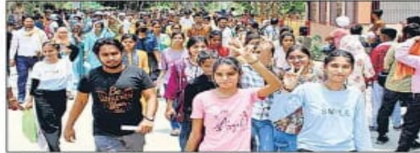
महायोगी गोरखनाथ विश्वविद्यालय में प्रवेश परीक्षा देकर बाहर निकलते अभ्यर्थी।

लैब टेक्नीशियन, इमरजेंसी एंड ट्रामा केयर टेक्नीशियन सहित 7 अन्य विषयों की परीक्षा का आयोजन हुआ। प्रवेश परीक्षा में सम्मिलित हुए अभ्यर्थियों के साथ ही अभिभावकों ने भी विश्वविद्यालय के प्रशासनिक संगठन की सराहना की।