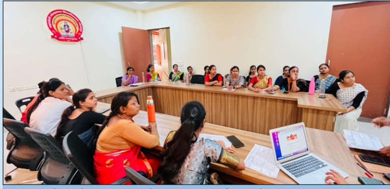
मेंटर ट्रेनिंग मीटिंग में उपस्थित नर्सिंग कॉलेज की शिक्षिकाएं

दिनांक 04 मई, 2024। को महायोगी गोरखनाथ विश्वविद्यालय गोरखपुर के अंतर्गत संचालित गुरु श्री गोरक्षनाथ