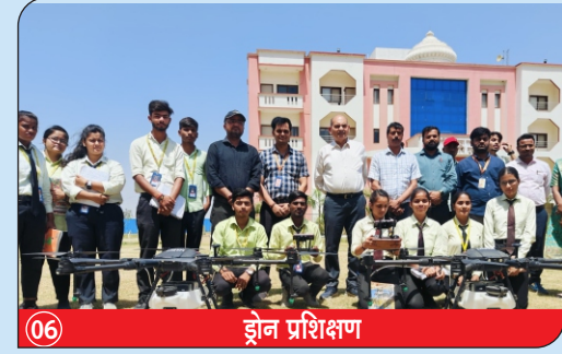
06 ड्रोन प्रशिक्षण