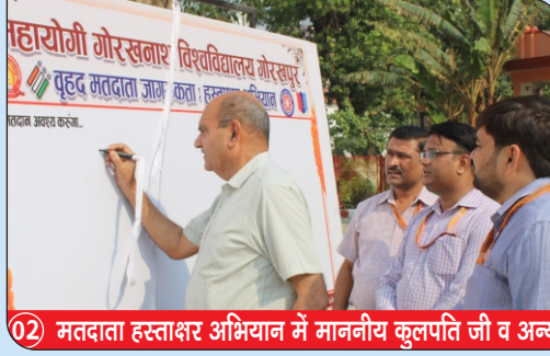
02 मतदाता हस्ताक्षर अभियान में माननीय कुलपति जी व अन्य