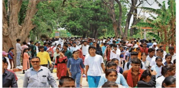
महायोगी गोरखनाथ विश्वविद्यालय परिसर से परीक्षा देकर निकलते अभ्यर्थी