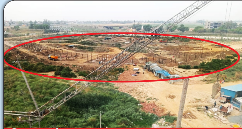
01 निर्माणाधीन क्रीडांगन