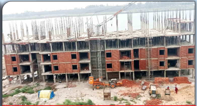
04 निर्माणाधीन शिक्षक आवास