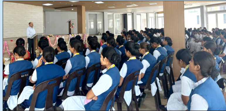
विद्यार्थियों को सम्बोधित करते हुए माननीय कुलपति जी