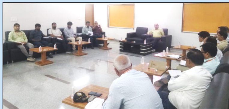
विश्वविद्यालय में आयोजित की गई प्रवेश समिति की बैठक