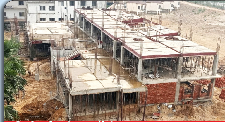
02 निर्माणाधीन फार्मसी संकाय