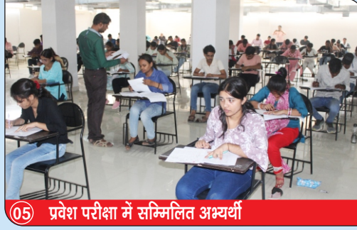
05 प्रवेश परीक्षा में सम्मिलित अभ्यर्थी