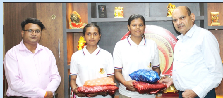
एन.सी.सी. कैडेट्स का उत्साहवर्धन करते हुए माननीय कुलपति जी