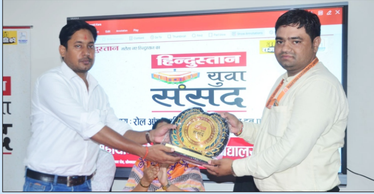
दैनिक समाचारपत्र हिन्दुस्तान द्वारा विश्वविद्यालय में युवा संसद का आयोजन

दिनांक 28 मई, 2024। को के आओ राजनीति करें अभियान दैनिक समाचार पत्र हिन्दुस्तान के तहत मंगलवार को महायोगी