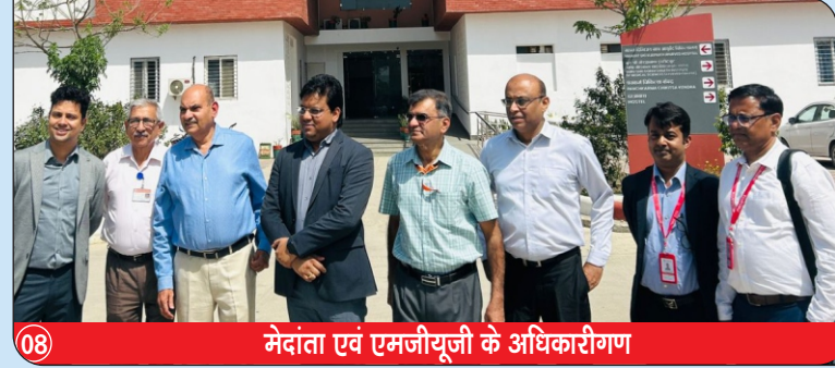
08 मेदांता एवं एमजीयूजी के अधिकारीगण