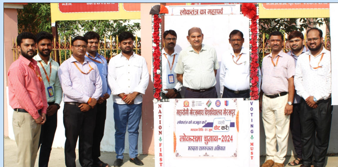
मतदाता जागरूकता के सेल्फी प्वाइंट के दौरान विश्वविद्यालय के माननीय कुलपति एवं अन्य प्राध्यापकगण